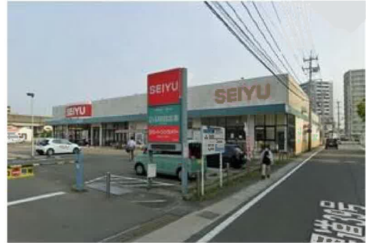
西友南仙台店まで310m