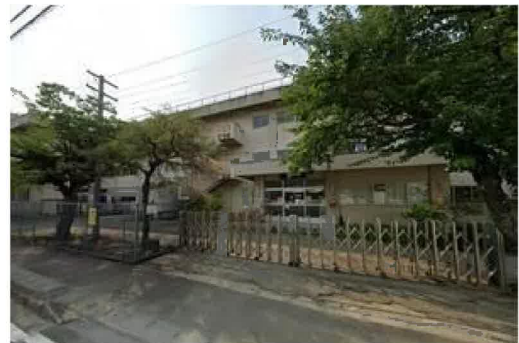
仙台市立中田小学校まで500m