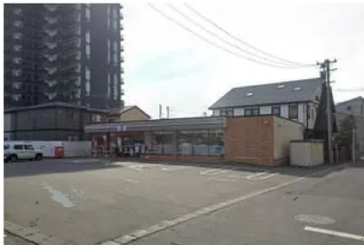
セブンイレブン南仙台駅前店まで590m