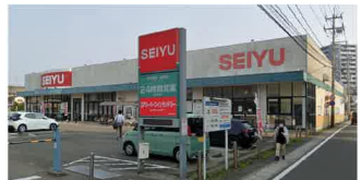
西友南仙台店まで310m(徒歩4分)