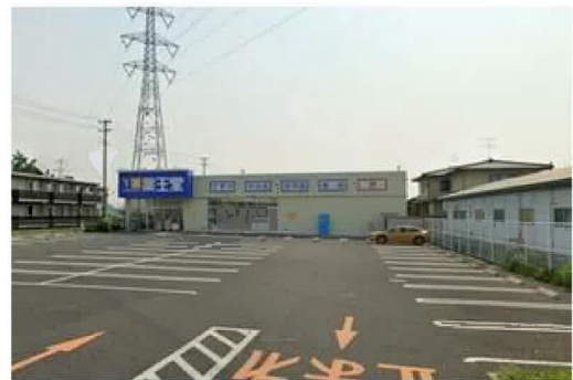
薬王堂仙台中田店まで810m