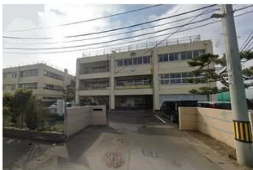
仙台市立中田中学校まで890m