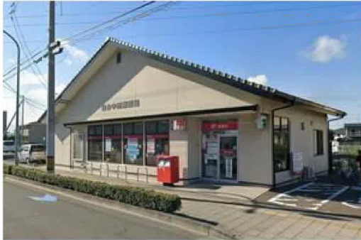
仙台中田郵便局まで840m