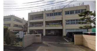
仙台市立中田中学校まで890m(徒歩13分)