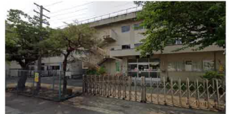
仙台市立中田小学校まで500m(徒歩6分)