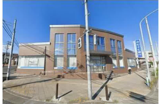
七十七銀行中田支店まで450m