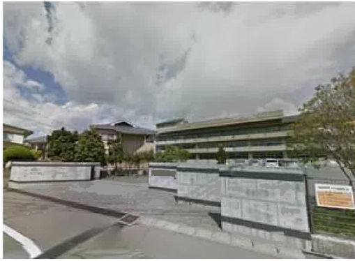
多賀城市立高崎中学校まで430m