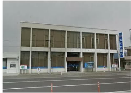
七十七銀行多賀城支店まで1,620m