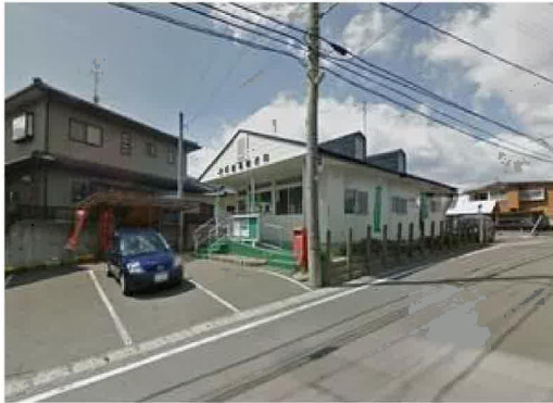
高崎簡易郵便局まで540m