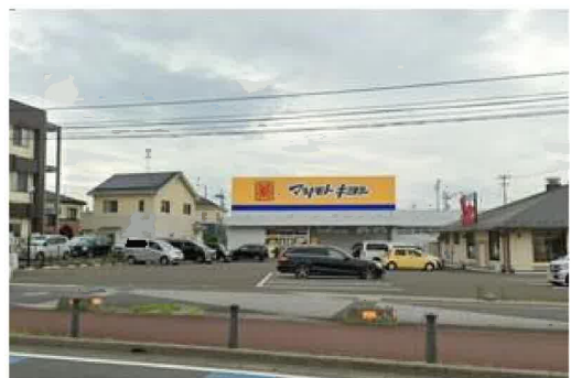
マツモトキヨシ多賀城城南店まで640m