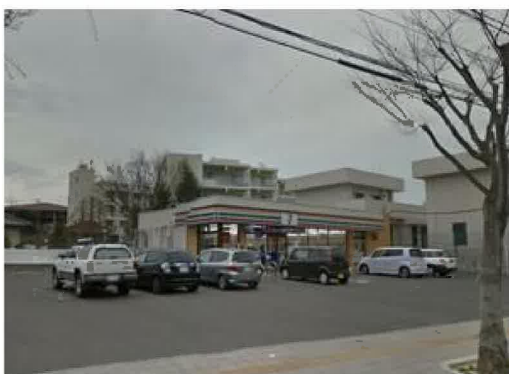
セブンイレブン多賀城高崎3丁目店まで170m