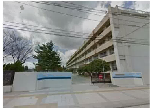
多賀城市立城南小学校まで1,020m