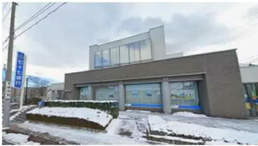
七十七銀行中山支店まで1,140m