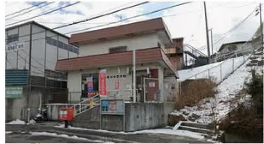
仙台北沢郵便局まで710m