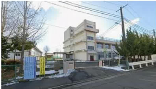
仙台市立中山中学校まで1,030m