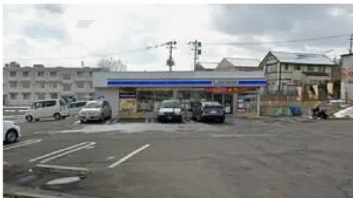
ローソン仙台川平一丁目店まで370m