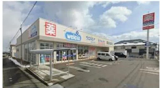
ウエルシア仙台中山店まで490m