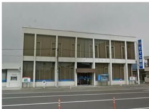
七十七銀行多賀城支店まで1,620m