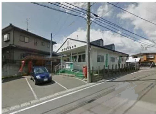
高崎簡易郵便局まで540m