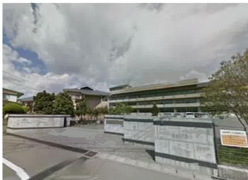
多賀城市立高崎中学校まで430m