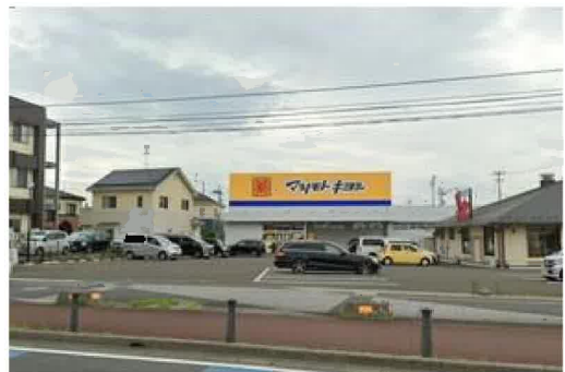
マツモトキヨシ多賀城城南店まで640m