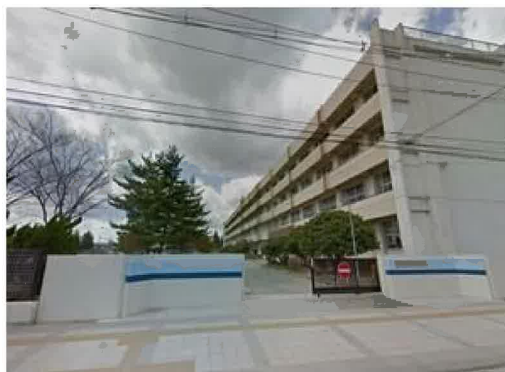
多賀城市立城南小学校まで1,020m