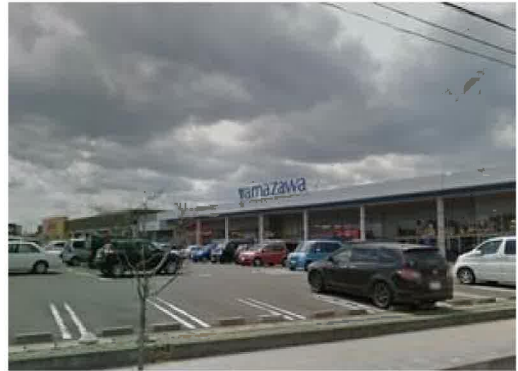
ヤマザワ多賀城店まで770m