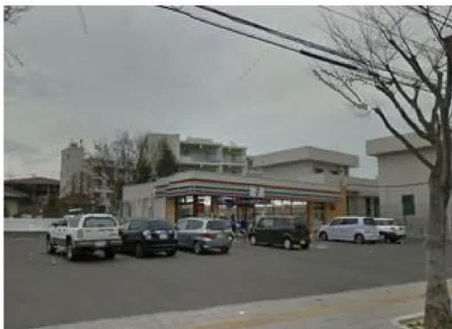
セブンイレブン多賀城高崎3丁目店まで170m